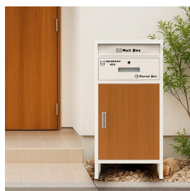
様々な宅配ボックスがあります。

→(市民生活部長) 通信販売がより日常的になり、宅配便の取り扱い個数は年々増加している。再配達削減は二酸化炭素削減のためにも取り組むべき課題である。宅配ボックスの設置は、再配達削減に効果がある。